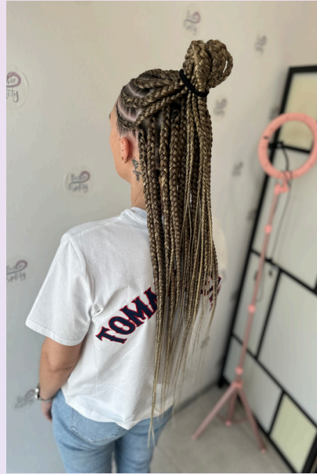
Fulani braids - warkoczyki afrykańskie z górą cornrows, wersja gruba około 30/40szt warkoczyków, długość 65-70cm, wymiana koloru na ombre (+50zł) - cena 750zł + 50zł = 800zł