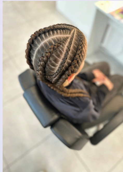
4 warkocze (230zł) + jeden mikrowarkoczek (+15zł) + asymetria przedziałków (50zł) = 295zł