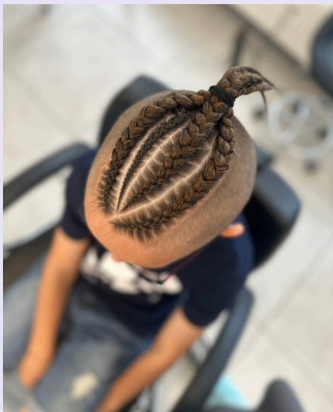
3 warkoczce cornrows męskich plecionych na wyspie (140zł) + asymetryczne przedziałki (30zł) + jeden mikrowarkoczek (15zł) = 185zł