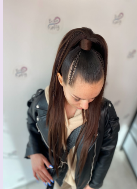
Kuc Ariana (zamiast przedniego środkowego warkocz dwa mikrowarkoczki) - bez dopłaty = 180zł