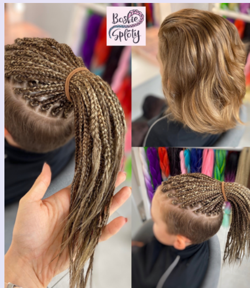
Standardowa ilość oraz długość warkoczyków męskich - 290zł