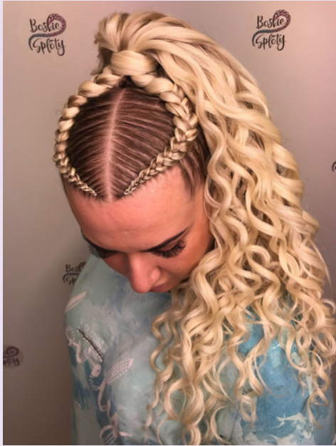
Kucyk przedłużany (200zł) + wymiana włosów na kręcone (2 opakowania) 2x (50zł) = 380zł