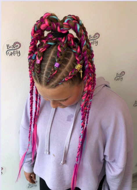
Kucyk z 6ciu warkocz - każdy warkocz splociony do końca -> liczymy z cennika warkocz cornrows -> 290zł