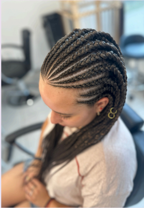
Fulani braids - warkoczyki afrykańskie z górą cornrows, wersja drobna około 70szt warkoczyków, długość 55-60cm - cena 850zł